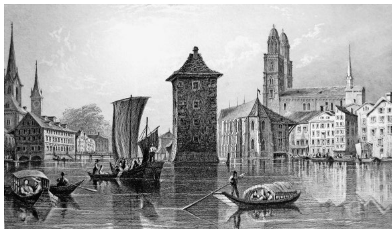
Mitten in der Limmat stand der Gefängnisturm Wellenberg. Es war der Ort, wo gefoltert wurde. Bild: William Henry Bartlett (1834)