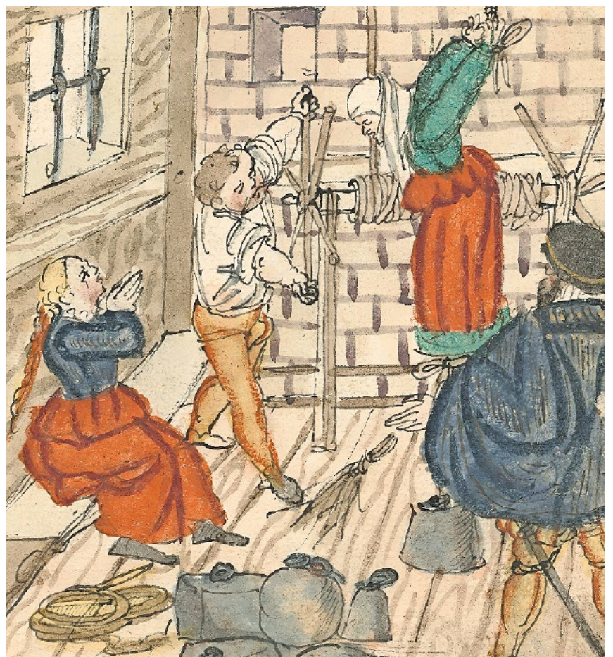
Was auf Papier stand, galt als Wahrheit: Solche Abbildungen dienten als Beweis für die Existenz von Hexen. Bild: Martin le Franc (1442)