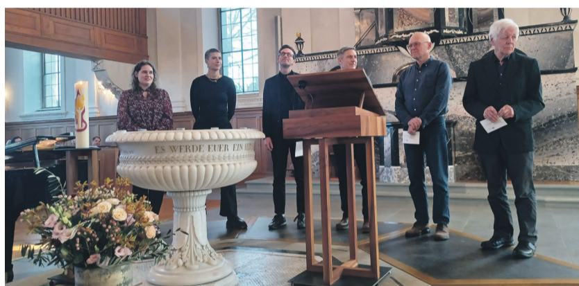
Feierliche Begrüssung neuer Kirchenglieder und Mitarbeitenden