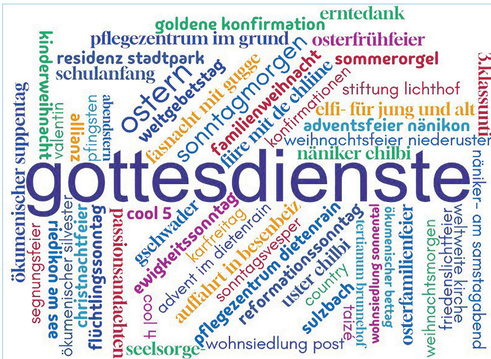
Lebendige Vielfalt an Feiern und Anlässen in der Kirche, in den Quartieren, Institutionen und für alle Altersgruppen