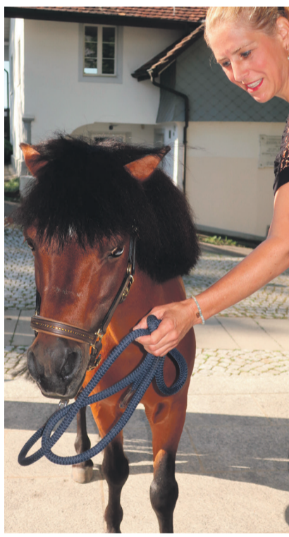
Hereinspaziert, hereinspaziert!