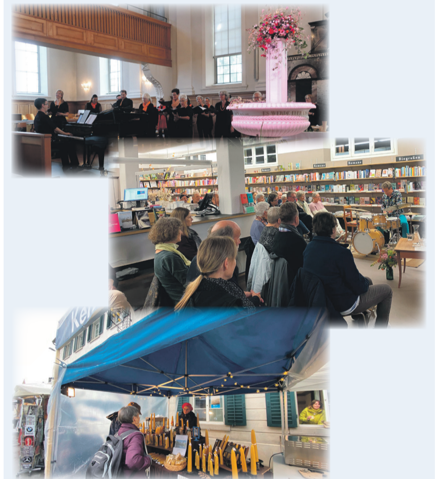
Unterwegs: in der Kirche, im Quartier, am Uster Märt

Vielschichtig, abwechslungsreich, vielversprechend, überraschend: Ein Kirchenjahr ist voll von Leben, von Gemeinsam-Unterwegssein. Gerne blicken wir darauf zurück.